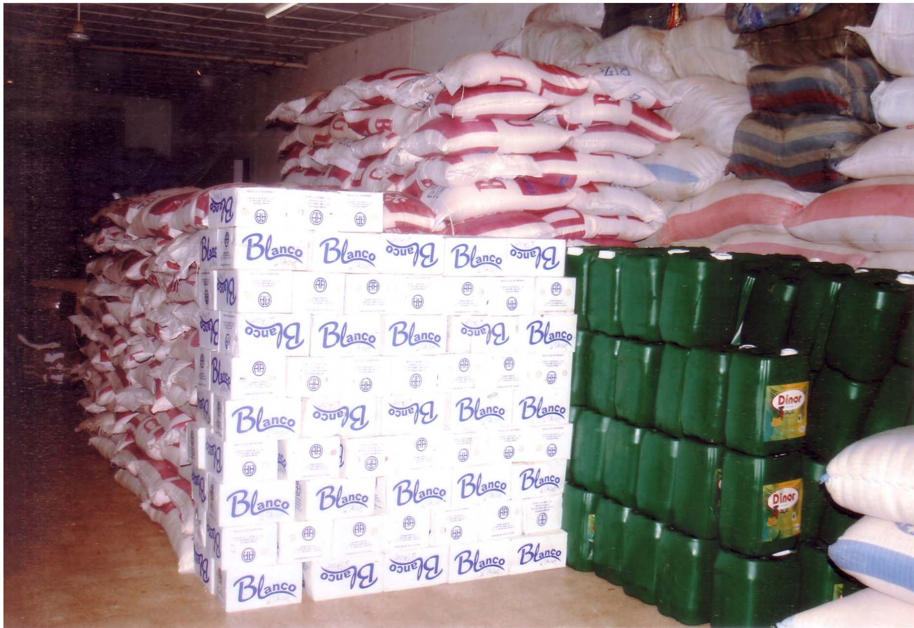
Des dons en nature pour les sinistrés du 1 er septembre.