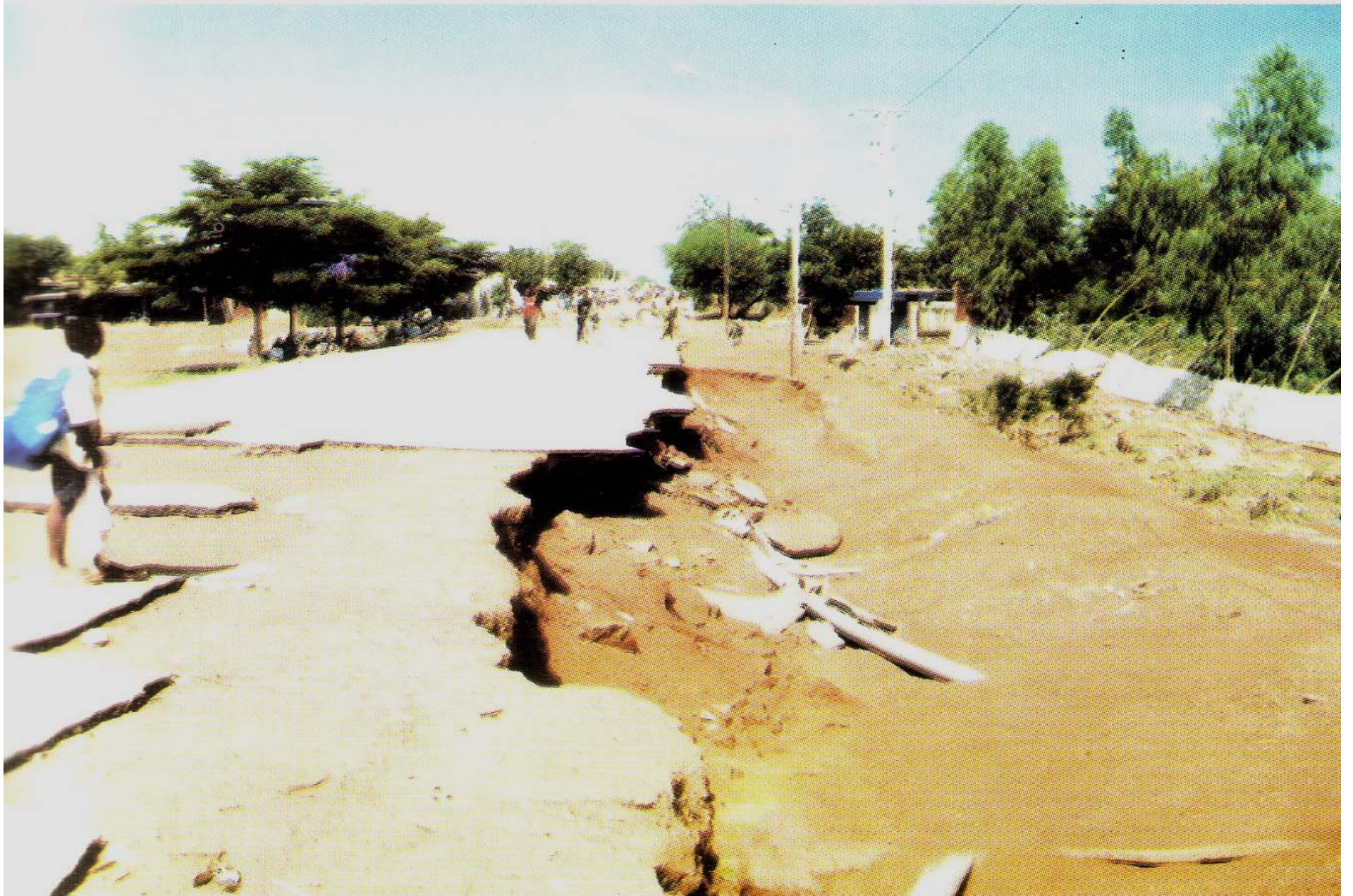
Pont endommagé par des flots ravageurs : trafic routier impraticable