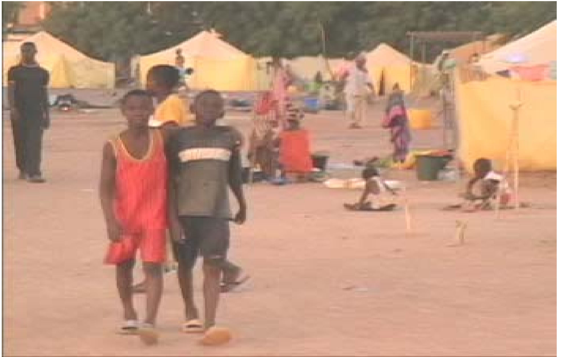
Site d'accueil des sinistrés, les uns et les autres vaquant à leurs occupations.