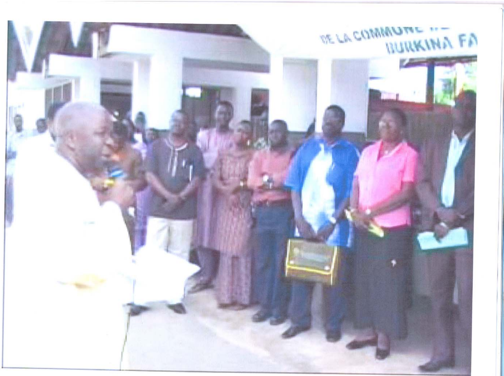
Mobilisation du 1 er responsable de la commune et ses collaborateurs pour la gestion du sinistre.