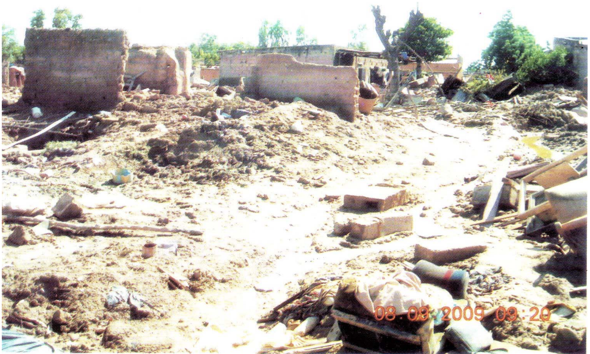
Maisons écroulées face à la furie des eaux, tristesse et désolation des populations