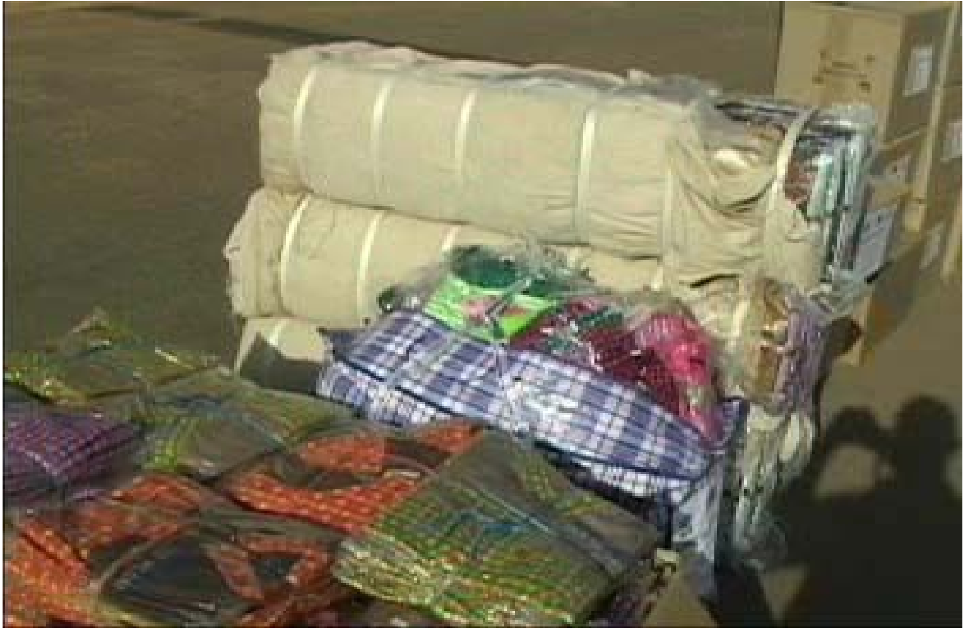
Des effets d'habillements offerts aux sinistrés