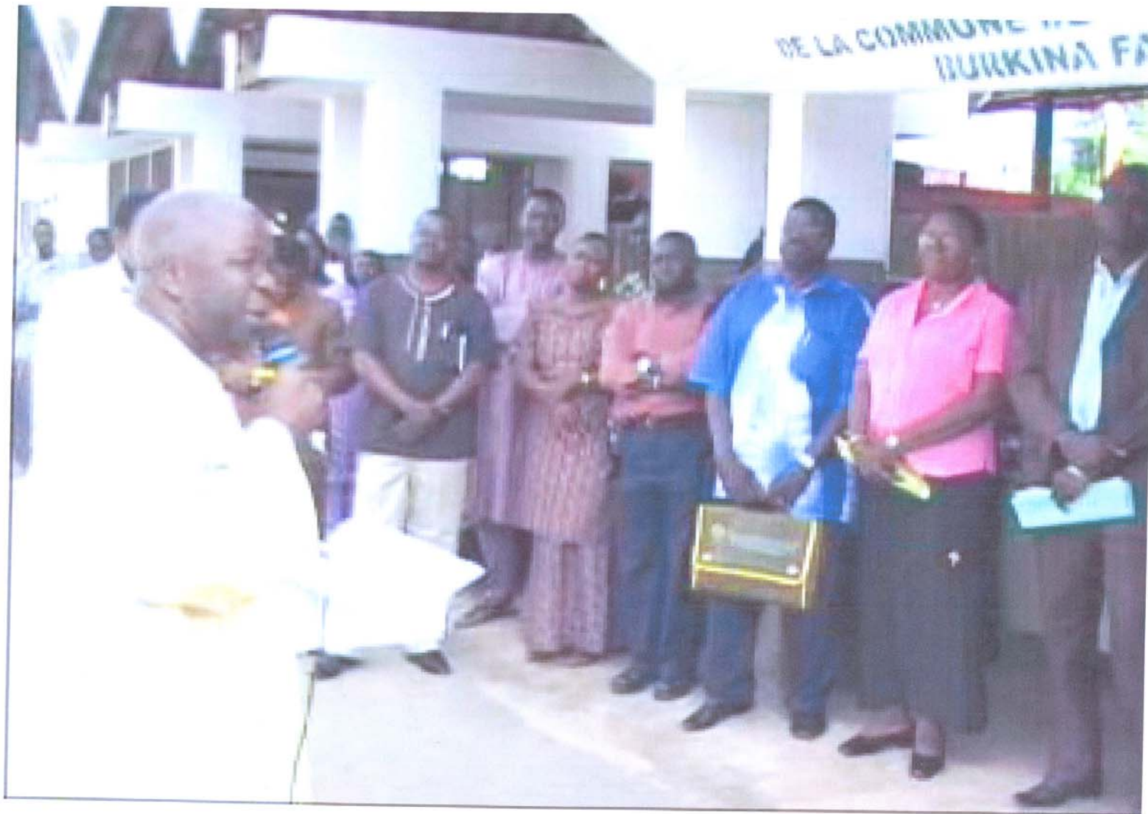
Mobilisation du 1 er responsable de la commune et ses collaborateurs pour la gestion du sinistre