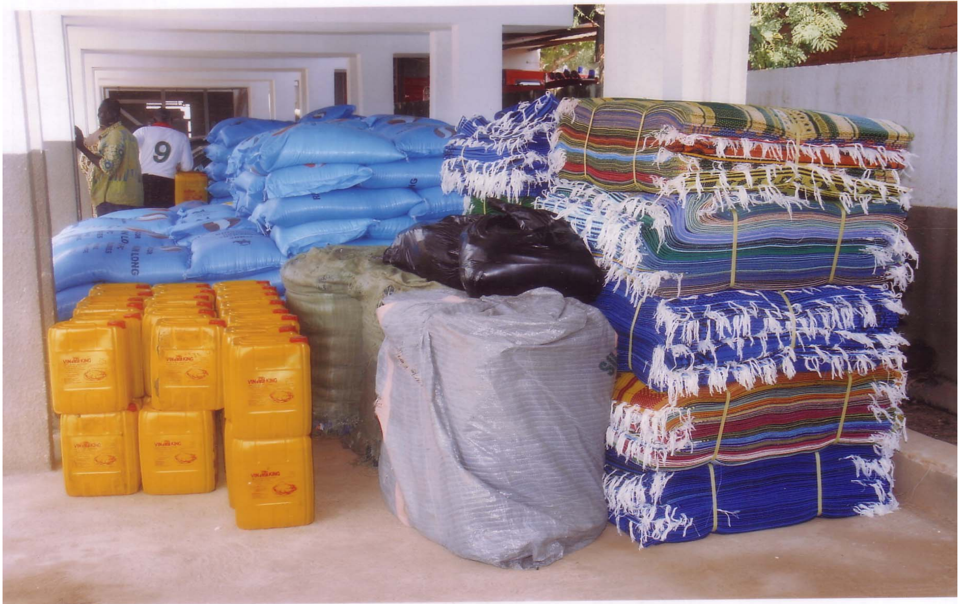
Dons divers au profit des sinistrés.