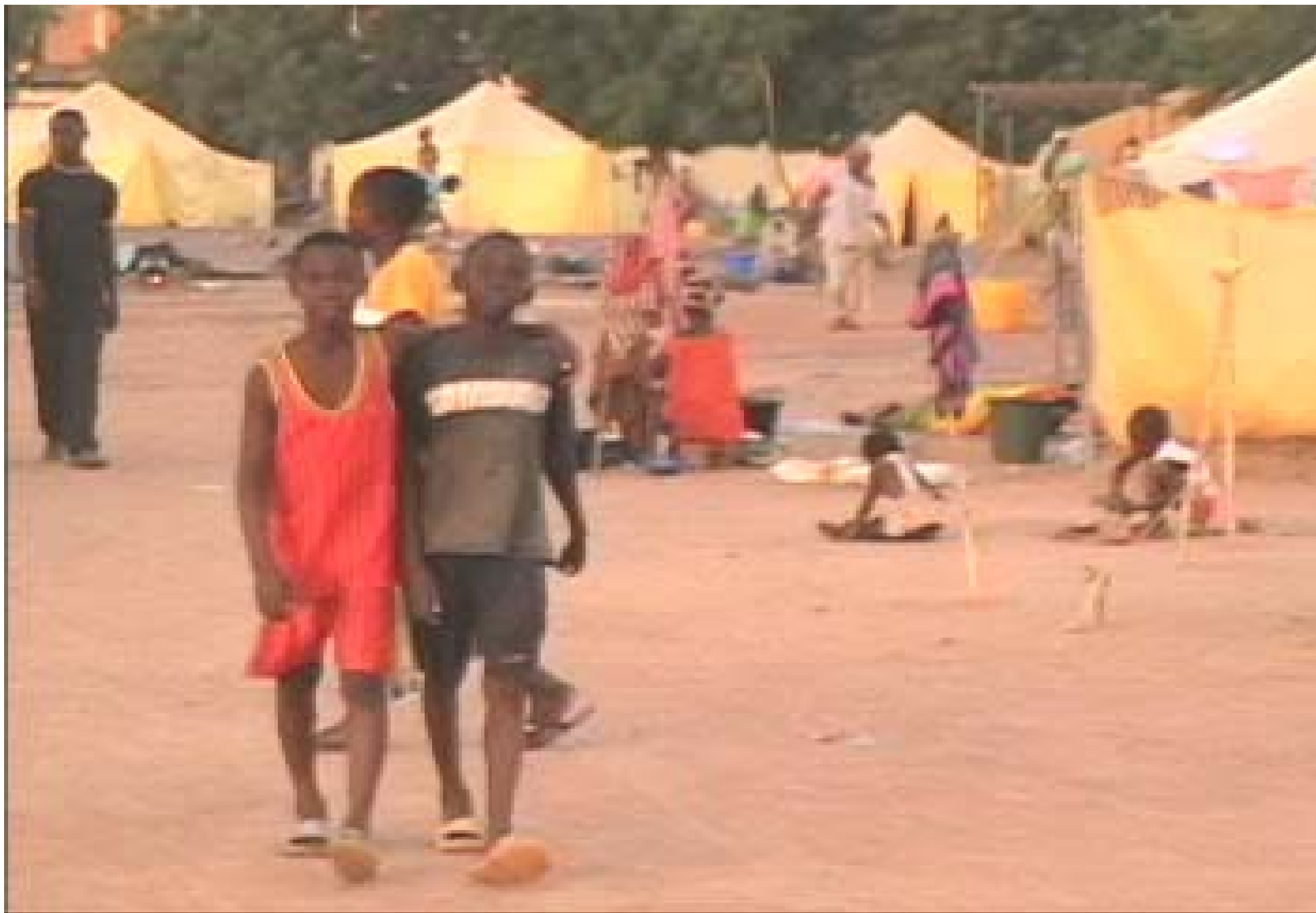
Site d'accueil des sinistrés, les uns et les autres vaquant à leurs occupations.