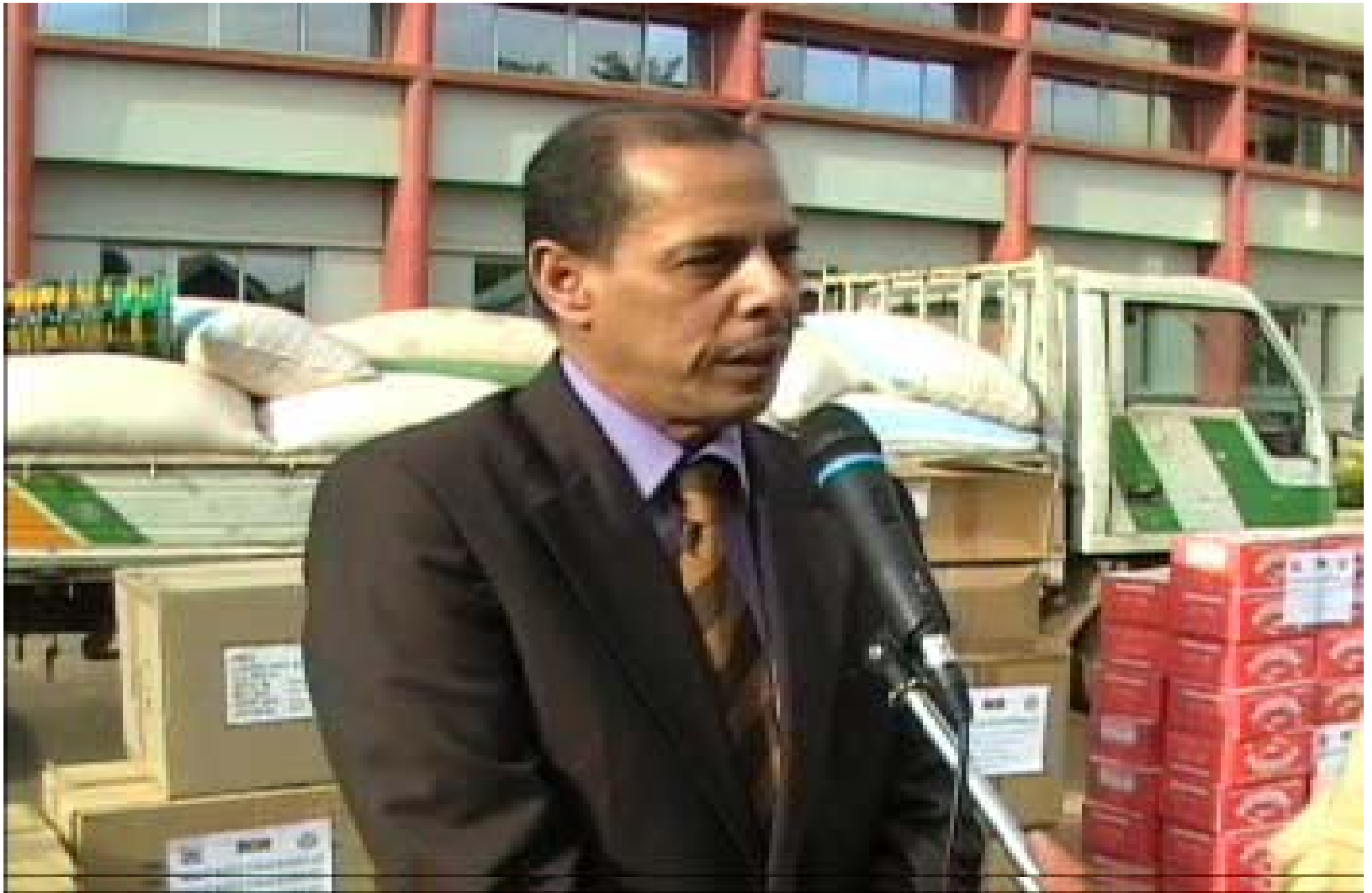
Dons du Président de la Banque Islamique de Développement (BID) représenté par le Directeur du Bureau Régional de la BID de Dakar