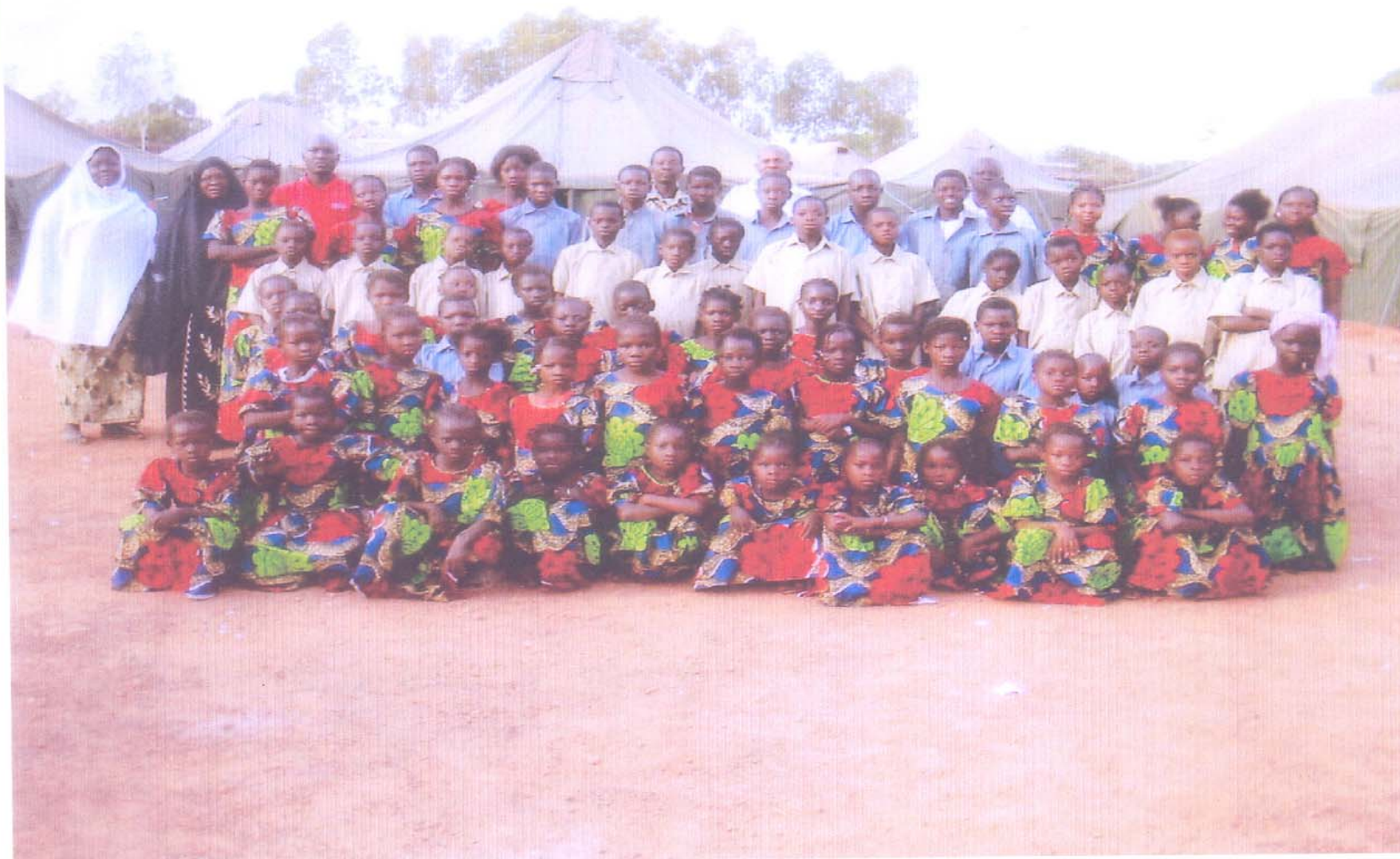
Des enfants sinistrés bénéficiaires des tenues en uniforme.