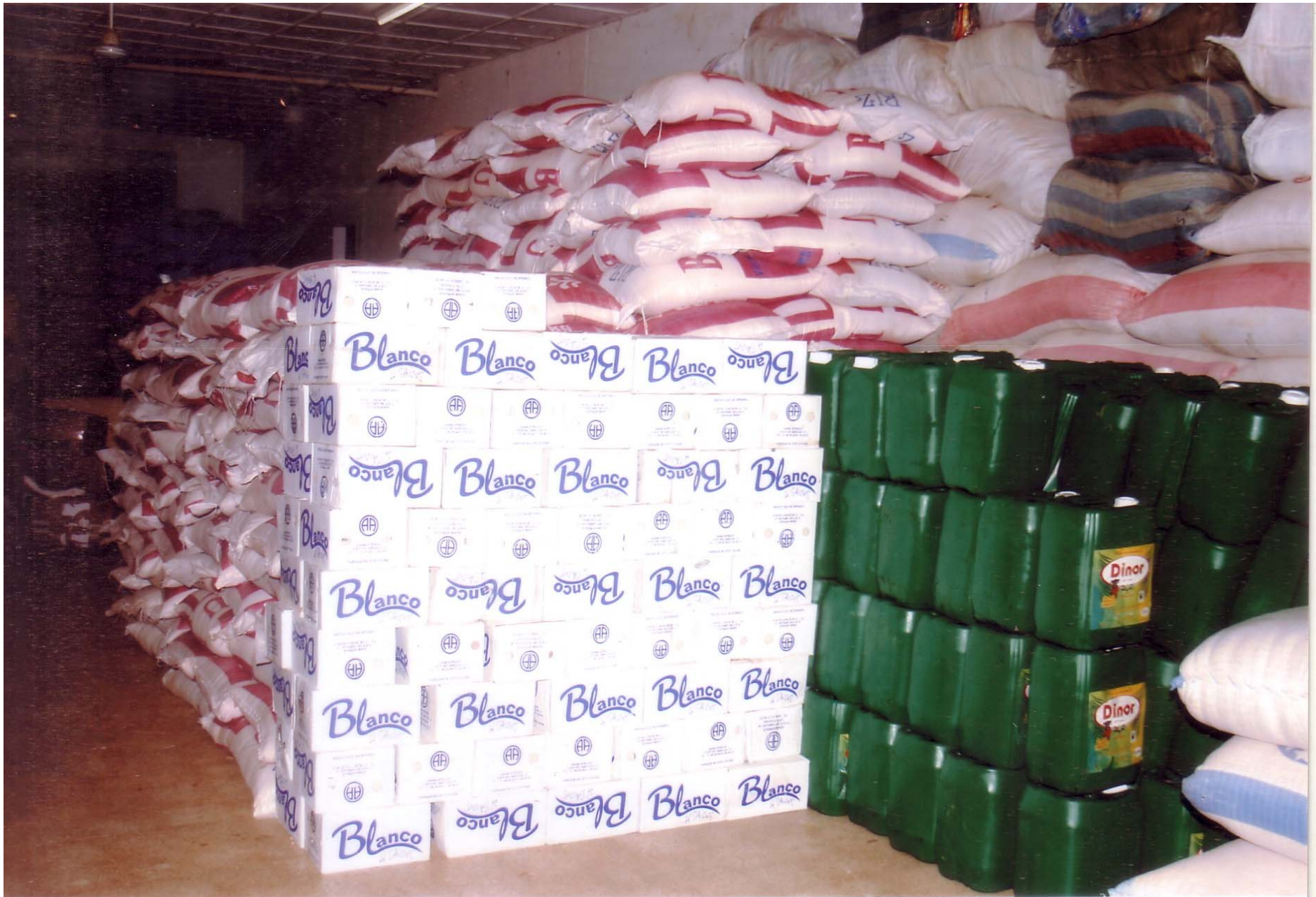
Des dons en nature pour les sinistrés du 1 er septembre