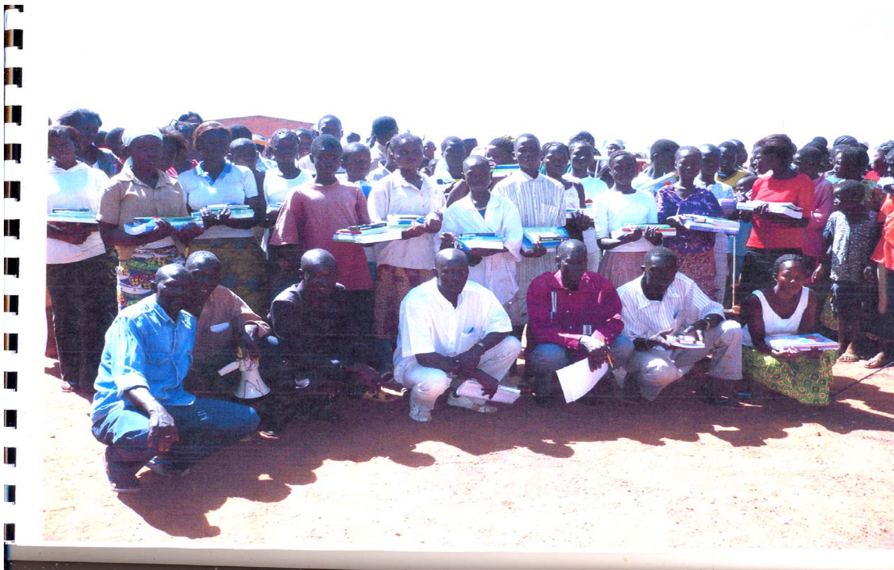
Des élèves sinistrés recevant des kits scolaires.