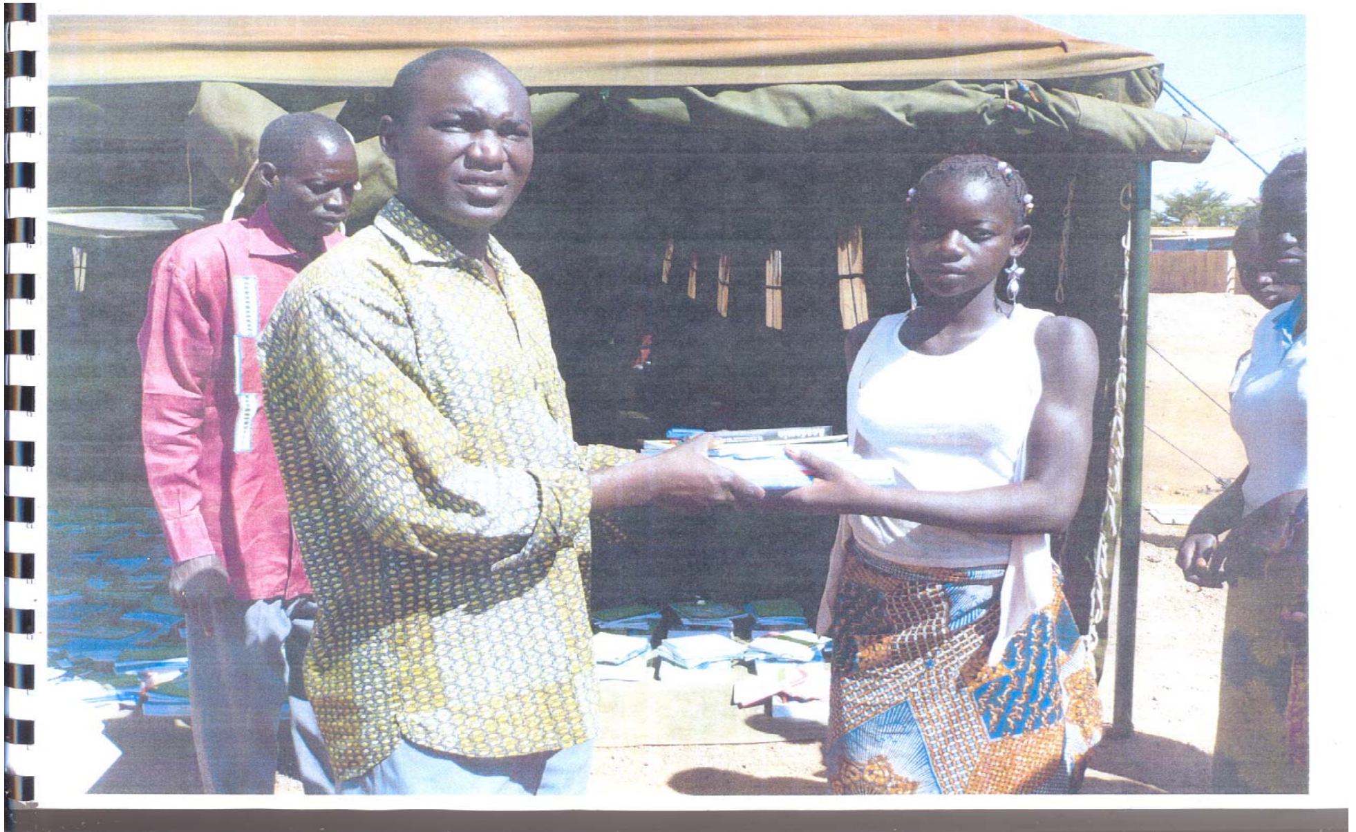
Une élève sinistré recevant son kit scolaire des mains d'un agent de la commune.