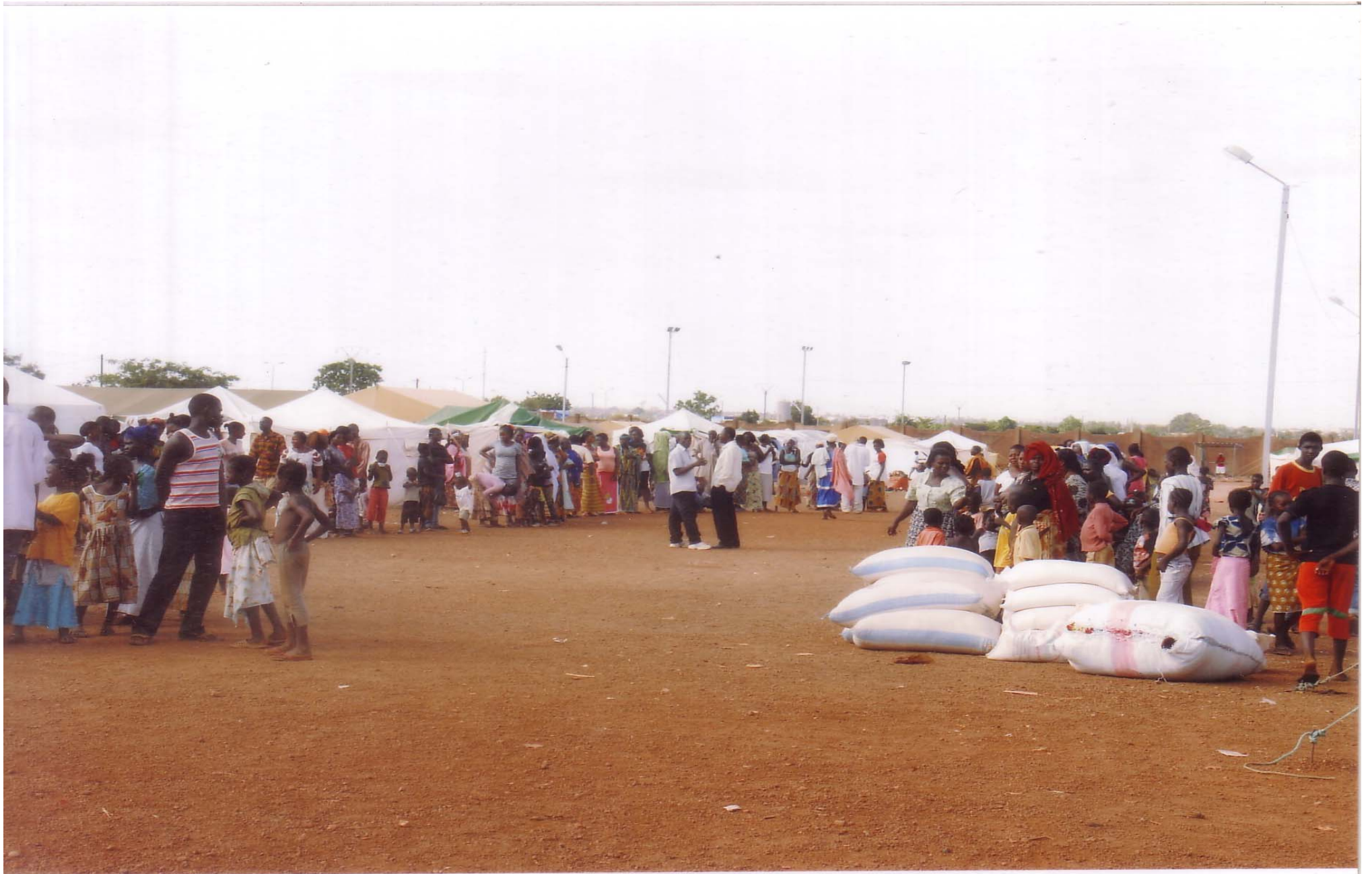
Dons de vivres aux sinistrés sur les sites d'accueil.