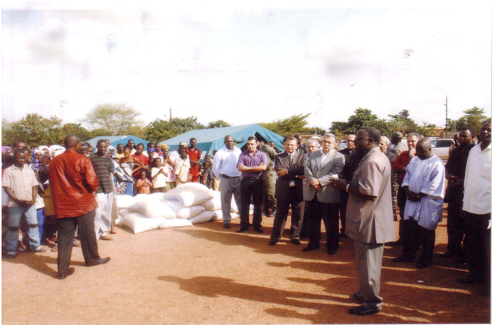
Dons de vivres des partenaires aux autorités municipales sur site de sinistrés